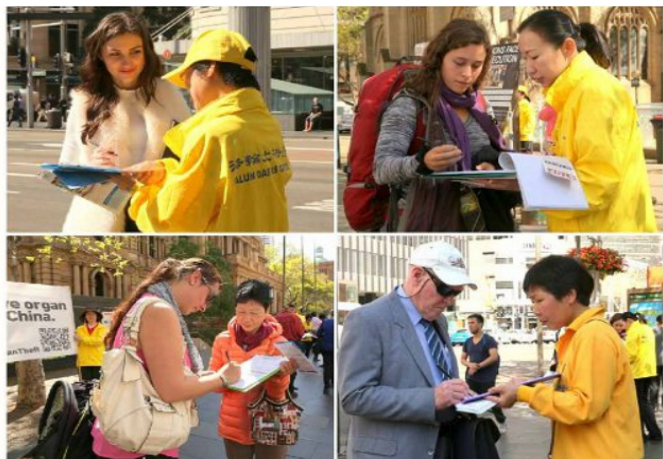
图1-4：澳洲民众支持和声援诉江的人越来越多

近来，越来越多的中国法轮功学员控告江泽民，而在国际社会上，越来越多的民众包括政界、法律界等，越来越多各界社会人士声援控告迫害法轮功的元凶，将他们绳之以法。