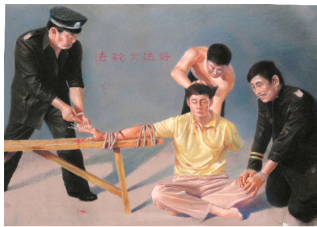
酷刑图示：用竹签扎手指（绘画）

在龙泉驿区看守所，狱警指使、纵容犯人对我施加重重折磨：在寒冬剥光我的衣服，反复用冷水浇灌；十余犯人轮流毒打，致我大量吐血；用竹签从我左手食指、中指之间插入，从手掌刺出；用三个点燃的烟头同时烫我左脸。为抗议这种非人虐待，我绝食绝水三天。第四天，狱警对我强行灌食。此后，他们逼我从事高强度劳作（手工制作针药盒），每天 14 个小时以上。为示抗议，我坚持不做，