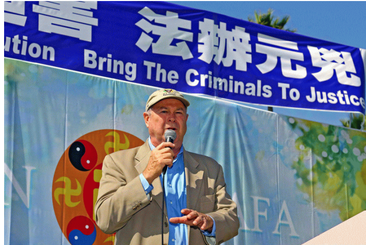
图：美国国会议员达纳·罗拉巴克 (Dana Rohrabacher)

罗拉巴克于二零一五年十月二十七日接受采访时表示，支持法轮功学员大规模控告迫害元凶江泽民，