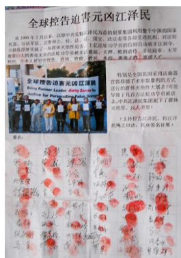
右图：河北省张家口市民众签名声援控告江泽民