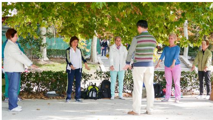
西班牙马德里的丽池公园里，每周都有市民来学炼法轮功。

他法轮功学员一起读法轮功的书籍、炼功。之前需要用药物抗忧郁的他感到生活越来越轻松。“我的思路非常非常清晰，每时每刻我都知道我该说些什么。我能感受到别人的想法和需求，以及我怎么能帮助他们。所有的事情都非常顺利。我意识到，法轮大法（法轮功）的书上所说的一切都是真的，我切实感受到了。”