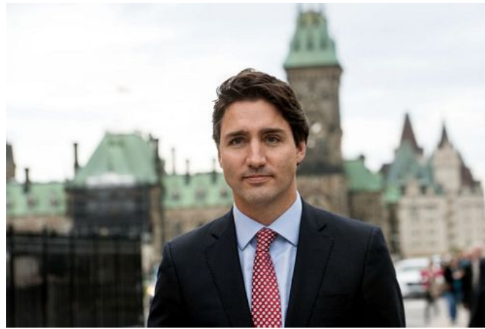
加拿大新任总理特鲁多 (Justin Trudeau)