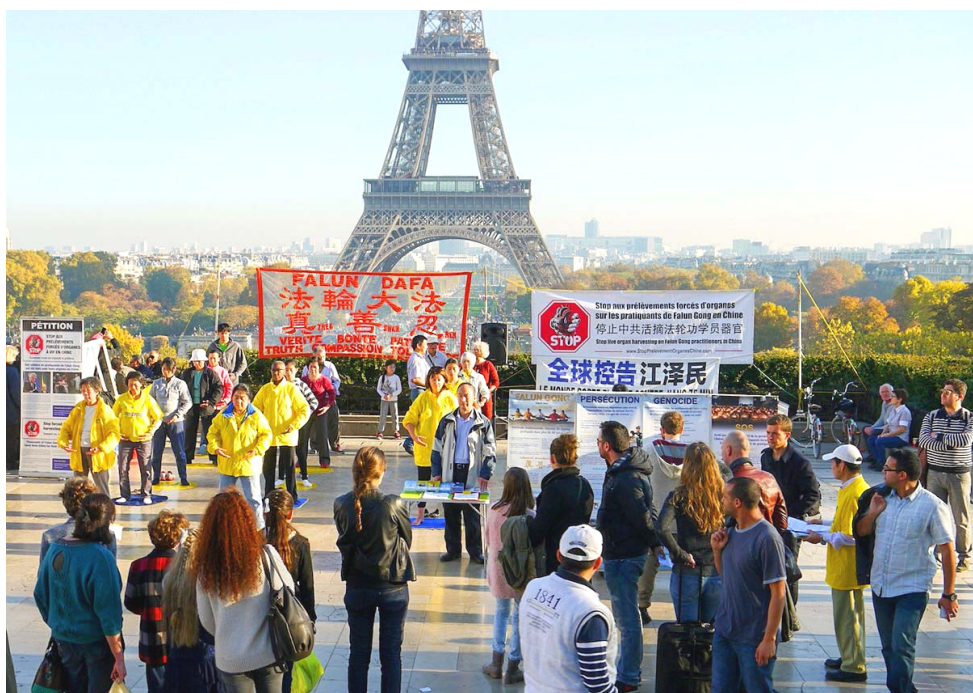
法轮功学员在艾菲尔铁塔下设立真相景点，并展示法轮功的功法。

“我们是义工，一分钱也不挣，就是把真相告诉你们，入过党团队的，举手宣过誓，退了才能保平安。”