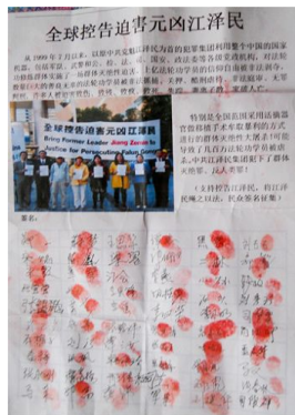
左图：诉江标语遍布雪中长春 右图：河北省张家口市民众签名声援控告江泽民