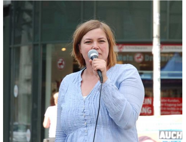
▲绿党汉堡议员卡特琳娜·费格班克女士