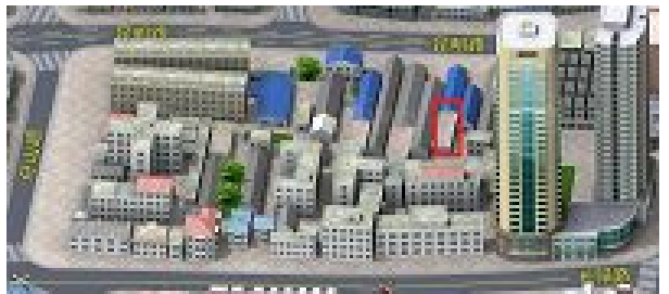
▲上海市提篮桥监狱七监区