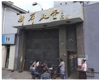
▲上海市提篮桥监狱后门