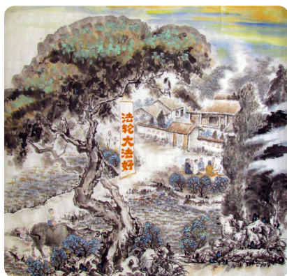
法轮功学员绘画：山村新风

像卢屋村这样的例子，还有很多。因为学炼了法轮功，村民间和睦相处，互助互让，婆媳、姑嫂等关系得以改善，很多人见证了这种神奇的变化，还常常称这样的村子为“法轮功村”。◇