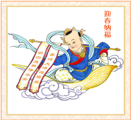
法轮功学员绘画作品

自己走走看。”结果她把着楼梯扶手一步一步地走上了三楼，这真是个奇迹！一个久病卧床不起的人，经过师父两分多钟的清理，刚听完师父一堂课后，竟然可以自己行走并上了三楼回到家中，真是不可思议的奇迹！感谢师父的救度之恩。传法班结束时，我们把写有“法轮功法科学瑰宝”的锦旗，敬献给了师父。