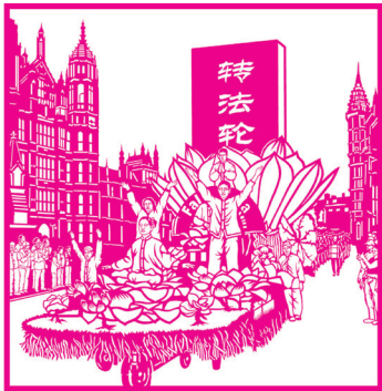
法轮功学员剪纸作品

1998 年 5 月初，在母亲劝说下，我修炼了法轮大法。母亲那时已修炼一年多，她修炼前患严重的心脏病、高血压、动脉硬化、哮喘等多种疾病，修炼法轮大法后都很快痊愈了。我看到了在母亲身上发生的奇迹和大法的美好超常。我早起上炼功点参加晨炼，白天抓紧学《转法轮》，心情无比喜悦。在日常生活中能按“真、善、忍”