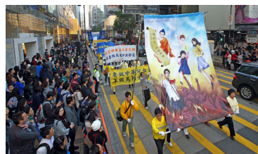
2015 年 1 月 17 日香港声援大陆退党大游行