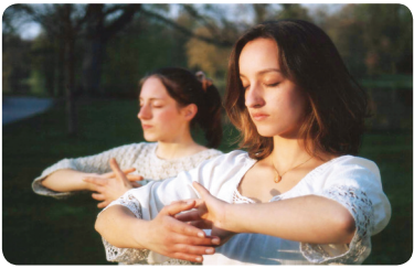
正在炼功的两姐妹

的，他知道《转法轮》这本书和那五套缓慢圆的功法。妈妈说：“我注意到，那五套功法对他而言非常非常重要，特别是第五套功法打坐。因为他非常活泼，可以说就像是多动的孩子，但是通过炼功让他安静，清醒，可以集中注意力。”◇