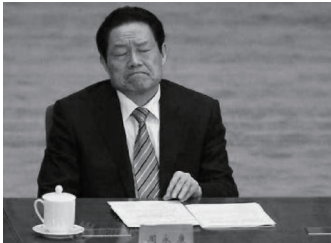
周永康被“满门抄斩”

到春天头和脸受风长红疙瘩奇痒无比。又长期在这种家庭环境里生活，整天精神郁闷，再加上经济困难，吃不好，睡不好，导致患上了脑血管神经性偏头痛、神经衰弱症、鼻窦炎、扁桃体炎、胃肠炎、乳腺小叶增生、妇科病等 10 多种顽固性疾病。尤其是偏头痛，几乎每天都吃去痛片等药缓解剧痛，经常痛得心烦意乱寝食难安，难忍时痛得撞墙，有时痛得神经错乱又哭又笑，多方治疗不见好转。鼻窦炎使我整天鼻塞不透气，睡觉需张嘴喘气，嗓子干疼，常年口腔溃疡。感冒如家常便饭，高烧多日，扁桃体经常发炎，肿痛得无法吃饭，使我整天痛苦不堪，真是生不如死。