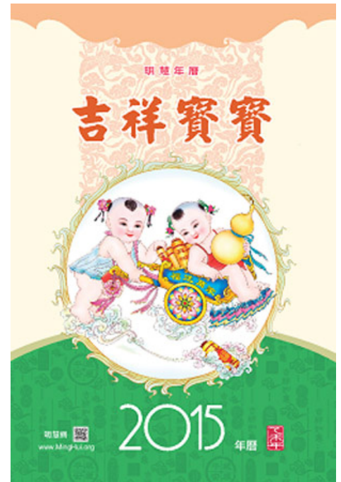
明慧真相挂历海外版封面

91.2 兆赫广播主持人接着介绍说，迫害和强制劳动促使郭先生逃出中国。同样是炼法轮功，郭先生在他的家乡是奴工，遭受迫害，在德国是跨国电气工程师，在公园炼功，这个区别实在太大了。◇