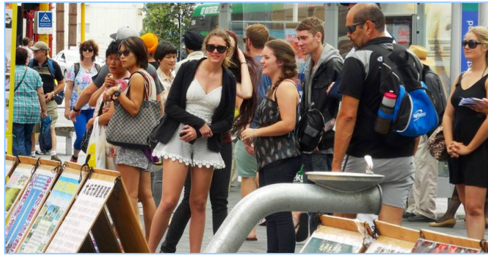
图：2015 年 1 月 17 日新西兰法轮功学员在奥克兰庆祝一亿九千万民众“三退”。上图是民众关注法轮功的真相展板。

义工问这群东北老乡：“都三退了吗？”有的说早退了，是国内炼法轮功的亲戚给退的；有的说是翻墙到