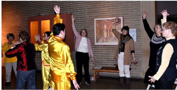
图：2015年1月31日，在美国常青藤名校宾州大学举行了中国新年庆祝活动，许多人兴趣盎然地学炼法轮功。

当第三次去医院化疗，血常规不正常，打了八针升红细胞的注射，总算上去了一点点。还是不正常，医生说：血常规不正常不能化疗，否则有生命危险，回家