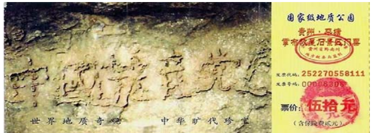
图：贵州“藏字石”风景区门票。

中国人当初在加入中共党团队时，曾经举着拳头发誓，要为中共奋斗终身，这是一个毒誓。而将来天灭中共时，没有解除这个毒誓的人就会被上天看成是中共的一份子，从而在天灭中共的种种劫难中随着中共一块被淘汰。“三退”无关政治，是为了解除当初对中共发