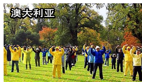
■ 世界各地法轮功学员集体炼功图选