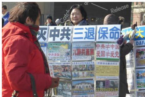
■美国自由女神像附近，法轮功学员向游客展示真相展板。2014 年 2 月 8 日，一位 70 岁的义工在此一个多小时劝退了七八十人，其中很多是会使用翻墙软件的大陆中学生。

字：“美”、“善”、“義（义）”，都包含“羊”字。这其中蕴含什么特殊意义呢？我们从象形文字的最初造字结构上，也许可以一探究竟。