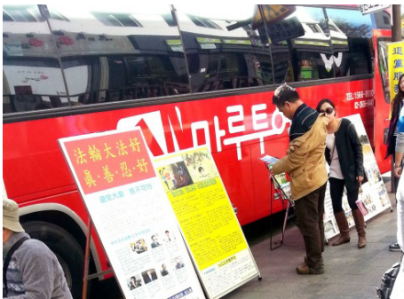
■在韩国首尔景点，大陆旅游团巴士旁的真相展板

法轮功学员听他这么说，安慰他说：不会总这样的，善恶到头终有报。迫害法轮功的徐才厚、周永康不是都被逮捕了吗？！不久就会被绳之以法的。那位先生说自己常翻墙上网，明白很多事。周围人都静静地听着。有游客说：像周永康、徐才厚这些共产党的头目都该抓起来！别说枪毙，千刀万剐都不解恨。有人说：中国历史上，哪一朝哪一代也没这么坏、这么腐败的，共产党算作到头了！