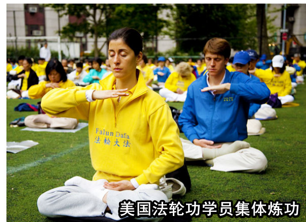
美国法轮功学员集体炼功