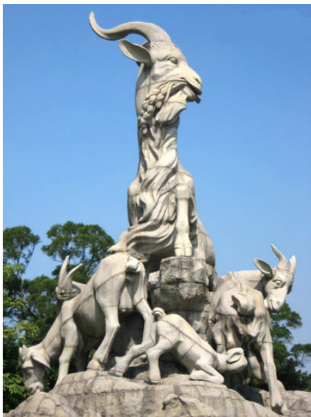
■广州市越秀山公园矗立着一座高 11 米的城市雕塑——五羊雕塑

可是，由于传统信仰的被破坏，人们渐渐地远离了这些文化的精神内涵。然而在上世纪 90 年代初，随着一个神奇功法的传出，人们通过亲身实践又一次见证了“神迹”的存在。