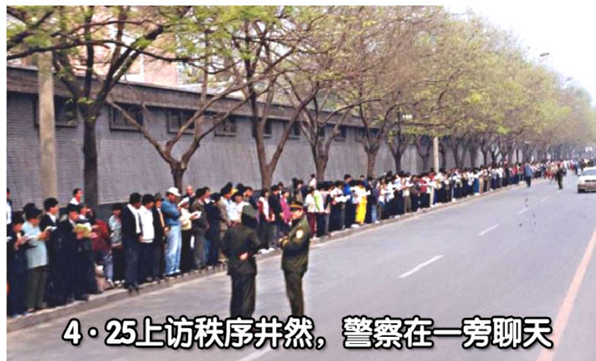
4·25上访秩序井然，警察在一旁聊天

【明慧网】我是学建筑的，1997年26岁时开始修炼法轮功。人生观从此发生巨大变化，明白了什么东西都是不失不得。想到自己手里还有一个金戒指以及一些礼品，都是平时施工方老板送的。我决心归还这些东西，于是把老板们一一找到，告诉他们：我现在学法轮功了，不能占别人的便宜。老板们非常吃惊，其中一人感叹：“我在本地建筑界干了20多年，从来没有遇到你这种人。”