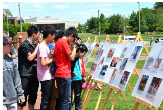
■在美国费城（上图）、芬兰（下图）景点，大陆游客认真观看真相展板。