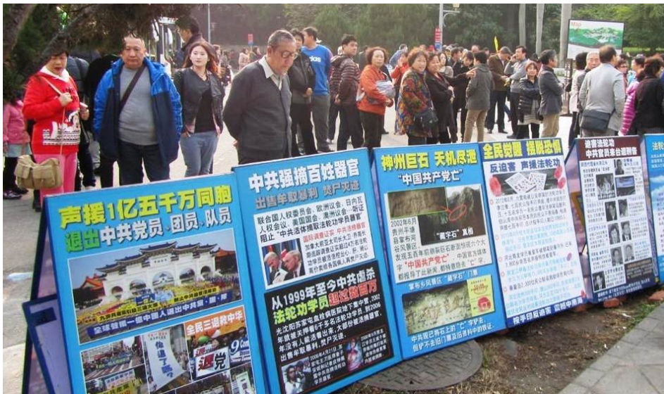
■台北故宫博物院附近，大陆游客在观看真相展板