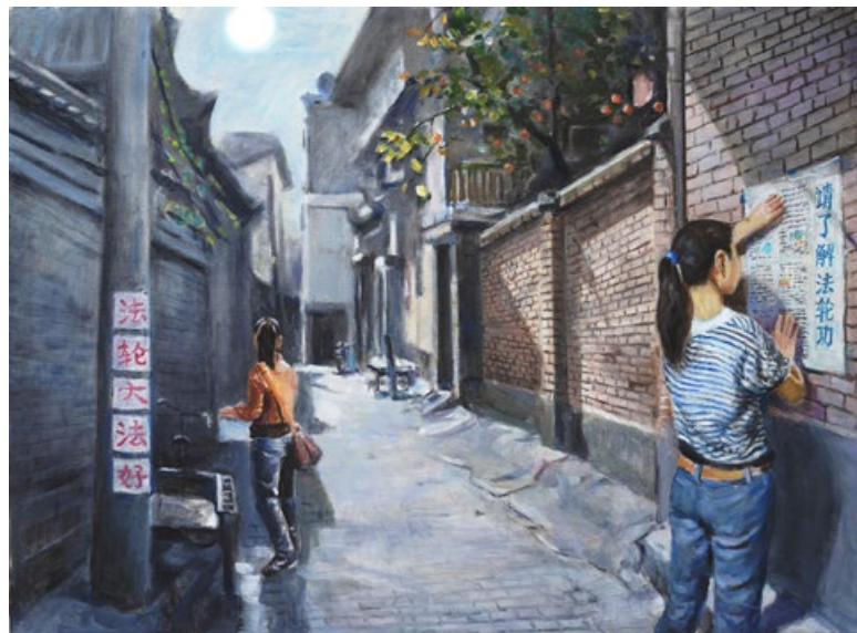
绘画《秋月奔忙》。在中国大陆，许多法轮功学员白天上班，很忙。他们利用晚上的时间，理智镇静地张贴真相资料救人。

另一次，在派出所里，我给所长和几个警察讲中共污蔑法轮功的谎言，讲“天灭中共”的必然。我用慈悲溶解了他们心中的坚冰。5天后，我离开了派出所，与我接触的6个警察，除所长外，其余5人都