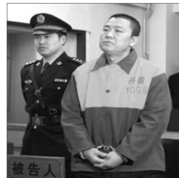
辽宁省沈阳市检察院原检察长张东阳被判无期徒刑

据明慧网不完全统计，2013年，辽宁省沈阳市有31名法轮功学员被非法庭审、判刑，排名全国城市迫害之首。