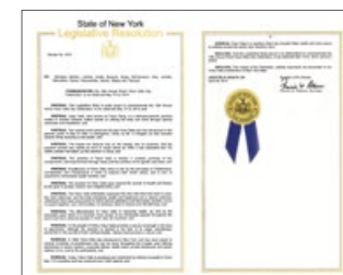
纽约州参议院第 4475 号立法决议案褒奖法轮大法

“尽管在其发源地（中国）遭迫害，法轮大法在全世界广受欢迎；法轮大法自 1996 年传入纽约，数以百计的修炼者在老人中心、公司、健身房和警察局等地举办过多个免费教功班；法轮大法被 100 多个国家的人们修炼和珍惜，收到褒奖、支持议案和信函 3000 多份……因此，纽约州参议院经过慎重考虑，通过决议，该决议敬呈纽约州法轮大法修炼者。”◇