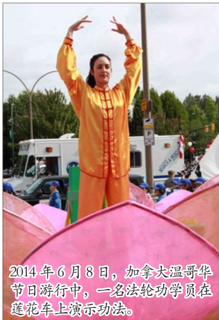
2014年6月8日，加拿大温哥华节日游行中，一名法轮功学员在莲花车上演示功法。