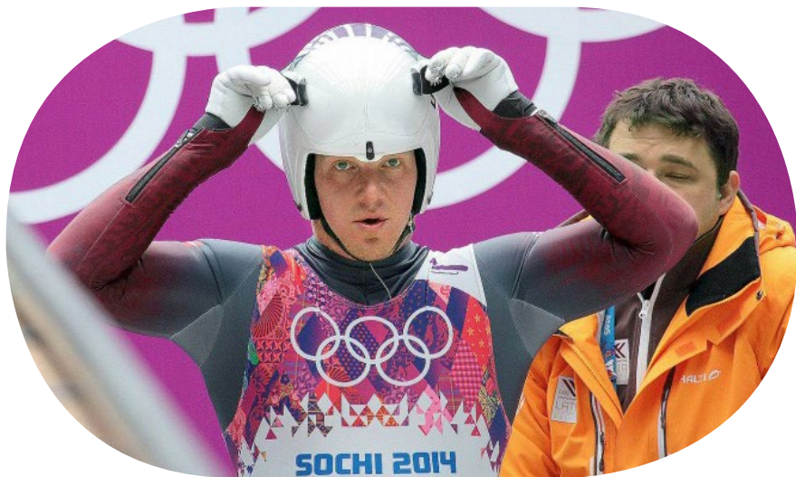
马汀斯·鲁本尼斯 (Martins Rubenis) 在 2014 索契冬奥会上