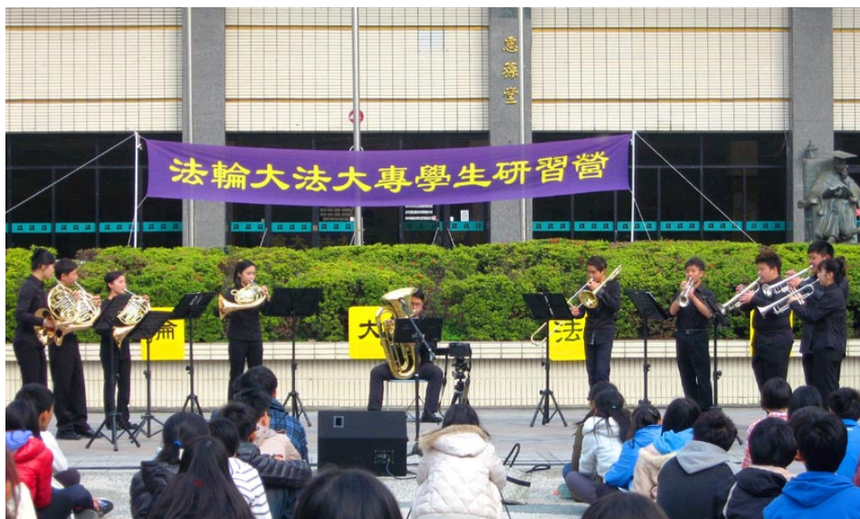
2015 年 2 月 6 日,台湾中兴大学惠荪堂前广场上的音乐会传递法轮大法的美好。