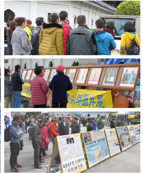
台北法轮功学员炼功 右上图：大陆游客看中共导演的“天安门自焚”假案视频。右中、下图：大陆游客看图片展和真相展板。