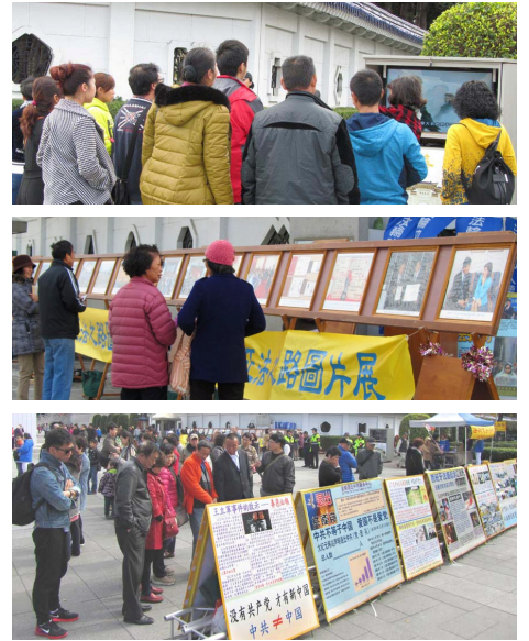
台北法轮功学员炼功 右上图：大陆游客看中共导演的“天安门自焚”假案视频。右中、下图：大陆游客看图片展和真相展板。