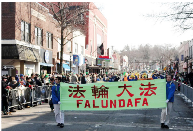
纽约地区法轮大法学员参加长岛亨廷顿游行受欢迎

©2015年3月8日，部分纽约地区法轮大法学员参加了长岛亨廷顿组织的一年一度的圣派翠克节游行，受到当地居民的热烈欢迎。当队伍经过主席台时，游行负责人和州众议员们纷纷高兴地和法轮大法学员握手并表示感谢。有的民众跑到学员的队伍中索要介绍法轮功的真相资料，还有的人向大法弟子挑起大拇指，有的说：我爱“真善忍”。