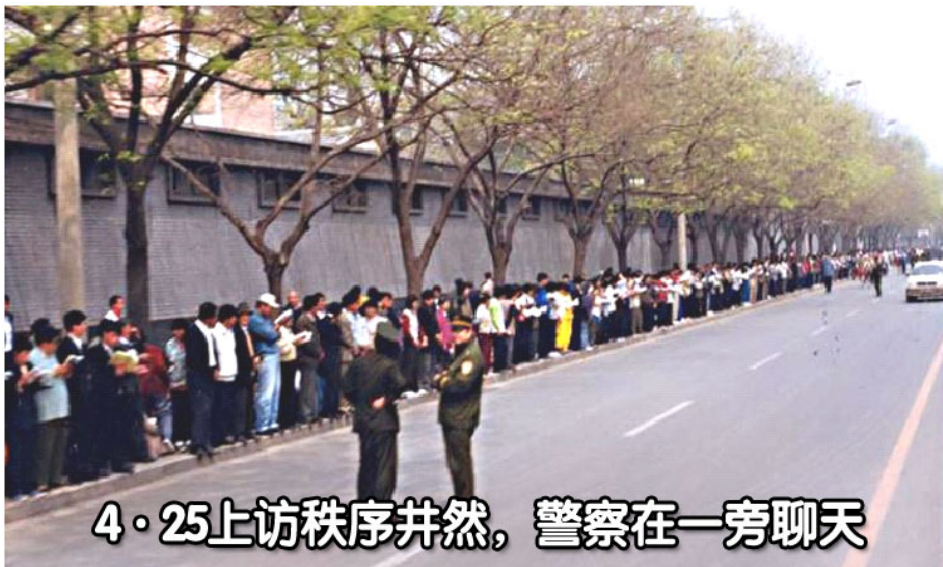
4·25上访秩序井然，警察在一旁聊天