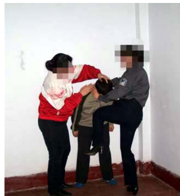
法轮功学员被扭打