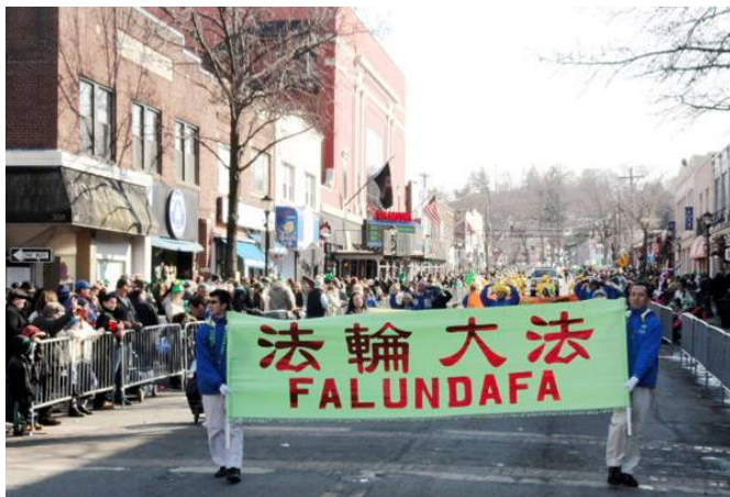
纽约地区法轮大法学员参加长岛亨廷顿游行受欢迎

©2015年3月8日，部分纽约地区法轮大法学员参加了长岛亨廷顿组织的一年一度的圣派翠克节游行，受到当地居民的热烈欢迎。当队伍经过主席台时，游行负责人和州众议员们纷纷高兴地和法轮大法学员握手并表示感谢。有的民众跑到学员的队伍中索要介绍法轮功的真相资料，还有的人向大法弟子挑起大拇指，有的说：我爱“真善忍”。