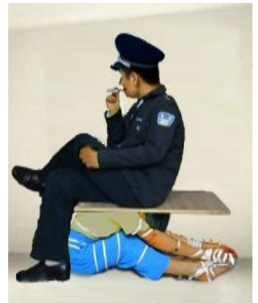
酷刑演示：木板压头加捆绑

恶警把法轮功学员手脚捆在一起，警察再在法轮功学员头上、身上压上木板，警察再坐在木板上、坐在法轮功学员身上。山东潍坊昌乐劳教所恶警用此酷刑残酷折磨法轮功学员。