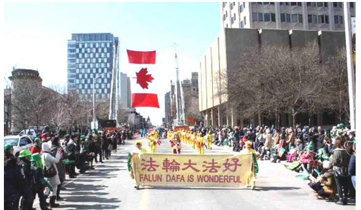
法轮功学员组成的腰鼓队 参加第二十八届圣派翠克节游行受欢迎