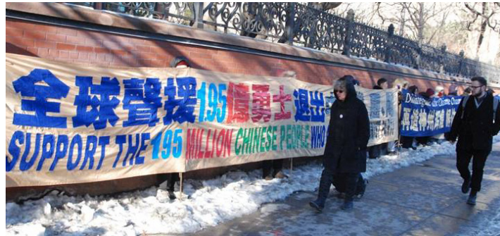
图：2015 年 3 月 2 日，加拿大多伦多法轮功学员在市中心举办真相长城，短短的几个小时，就有二百多人签名反对中共活摘器官，还有不少华人现场“三退”。

文化大革命等，导致很多传统文化消失。中共在获得政权前批评其它政府腐败，但现在人们看到，很多中共官员严重腐败，强征居民土地，收受巨额贿赂，对民众实施财政掠夺、性虐待，等等。可以说，“中共高层普遍腐败”。