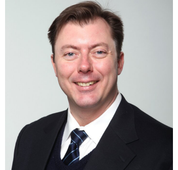
图：加拿大国会议员安德斯（Rob Anders）。