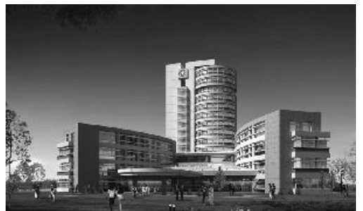
位于九眼桥的解放军 452 医院（原空军医院）