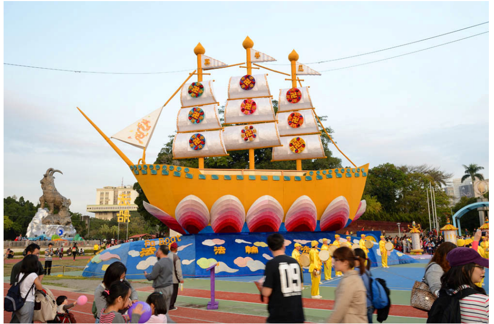
6 层楼高的“法船”花灯引人注目（图为日景）

“法船”花灯长 25 公尺、宽 8 公尺、高 18 公尺，灯会开展前，附近的民众、学生就专程前来参观、拍