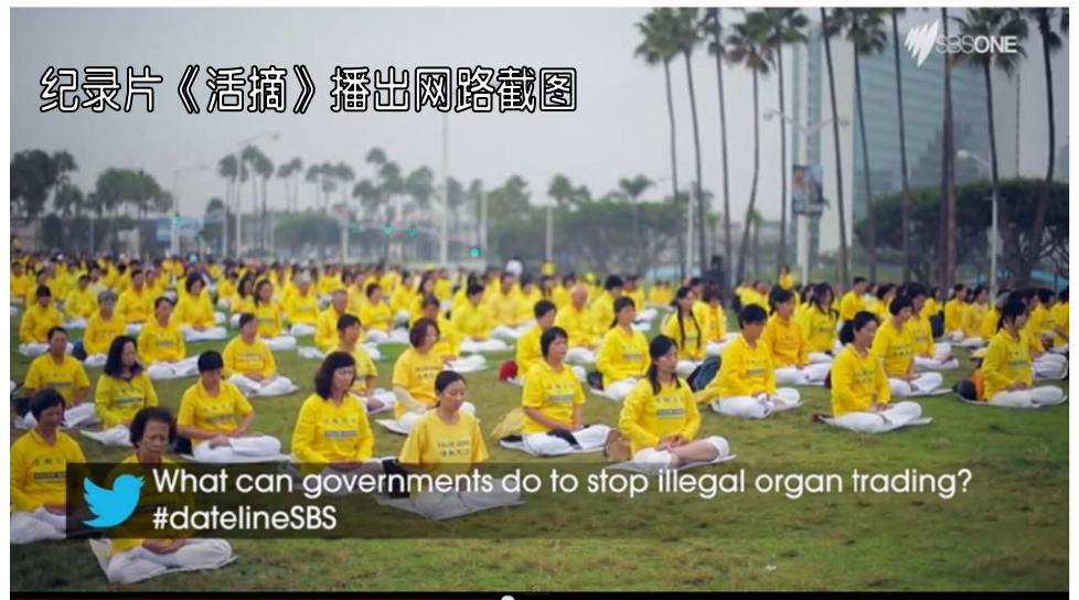
纪录片《活摘》播出网路截图

塔斯一起花费数年时间调查中共政府非法摘取器官。他们认为这些移植器官中有相当一部分来自法轮功修炼者群体,这是被中国当局打压的信仰群体,有数以百万计的修炼者。