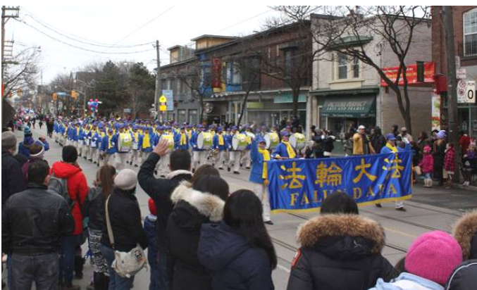
多伦多天国乐团参加2015年复活节大游行受瞩目

©2015年的复活节周日(4月5日),加拿大多伦多法轮功学员连续第八年应邀参加了多伦多第49届复活节大游行活动。一位从大陆刚出来3个月的中国男士观看了游行后感叹,“法轮功在海外如此地受欢迎,我亲身感受到了。”