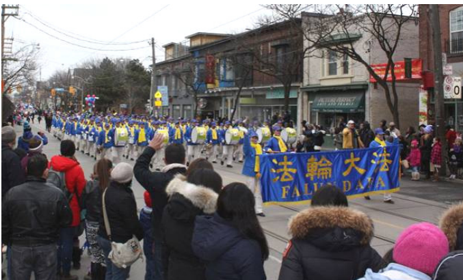
多伦多天国乐团参加 2015 年复活节大游行受瞩目

©2015 年的复活节周日 (4 月 5 日), 加拿大多伦多法轮功学员连续第八年应邀参加了多伦多第 49 届复活节大游行活动。一位从大陆刚出来 3 个月的中国男士观看了游行后感叹, “法轮功在海外如此地受欢迎, 我亲身感受到了。”