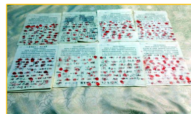
图：民众签名公审江泽民的图片