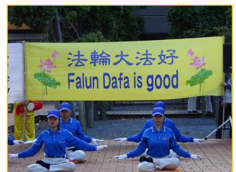
图: 法轮功功法演示

由法轮功学员组成的天国乐团在集会上表演了“法轮大法好”、“送宝”、“法轮圣王”等乐曲, 赢得了观众的热烈掌声。腰鼓队也为集会表演助兴, 许多人拍照留念。◇