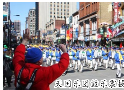
天国乐团鼓乐震撼