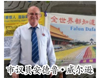
市议员安德鲁·威尔逊