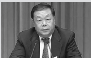
原天津市政法委书记、市公安局局长宋平顺，已自杀身亡。