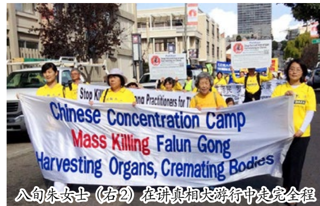
八旬朱女士（右2）在讲真相大游行中走完全程

泽民集团在中国发动了对法轮功学员的残酷迫害。朱女士开始走出家门讲真相，让受蒙蔽的同胞知道真相。如今，年过八旬的朱女士精力充沛，积极传播真相，希望更多的有缘人找到生命的春天。◇