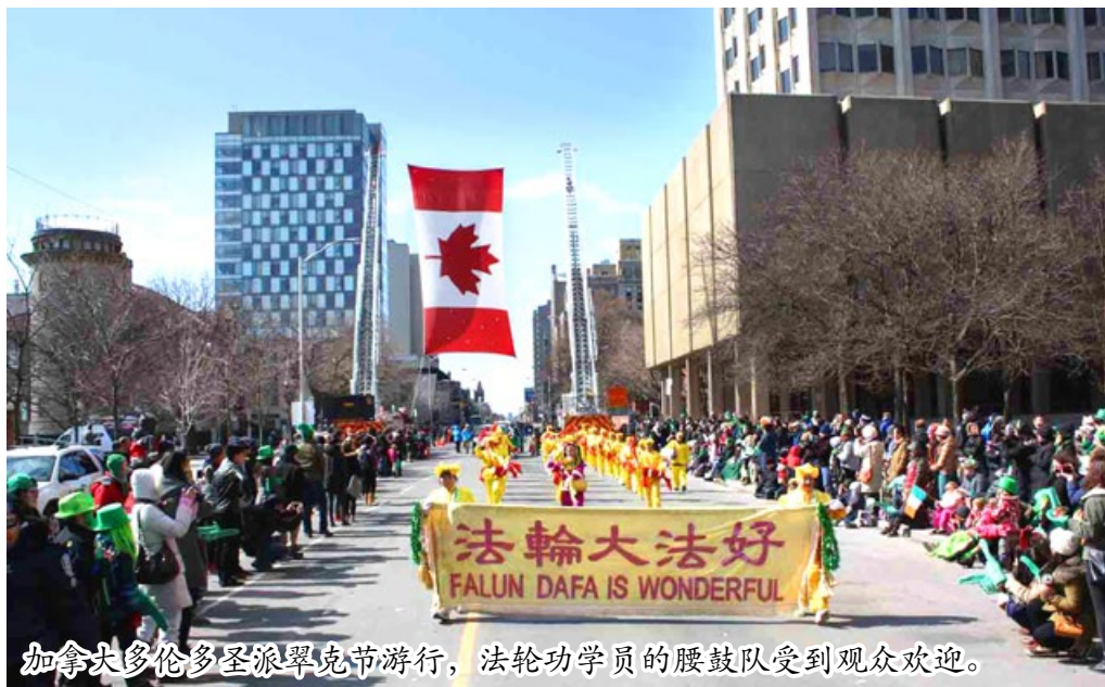
加拿大多伦多圣派翠克节游行，法轮功学员的腰鼓队受到观众欢迎。