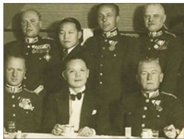
何凤山（前排中间）在回忆录《外交生涯四十年》中的照片

在耶路撒冷犹太纪念馆里有一座“国际义人园”，是以色列为了纪念那些冒着危险帮助犹太人的非犹太人而专门设立的。以色列对“国际义人”有着严格的规定：必须是非犹太人；没有伤害过犹太人；冒着危险帮助犹太人；未曾收受金钱报酬。目前纪念馆认定国际义人共有两万多人，中国外交官何凤山也位列其中。