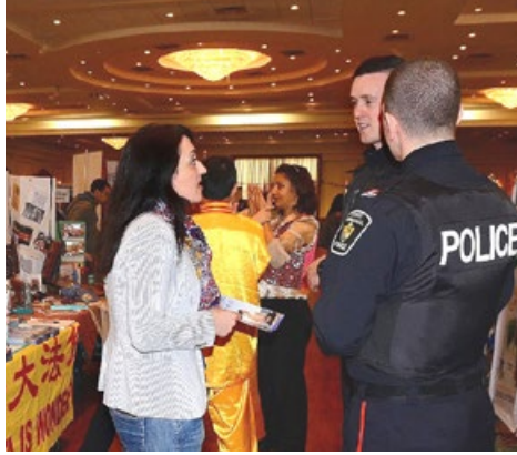
警察和民众前来了解法轮功真相