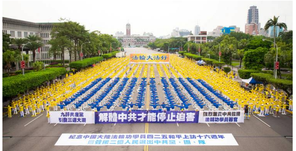
2015 年 4 月 19 日，台湾法轮功学员于总统府前广场--凯达格兰大道集体炼功

1999 年 4 月 25 日，为了反映在天津的修炼者被当地警察无端抓捕、殴打的情况，要求保障信仰权利，逾万名法轮功学员依法前往位于北京府右街的国务院信访办公室和平上访，要求当局释放此前在天津被当地警察抓捕的 45 名法轮功学员，允许法轮功的书籍合法出版，并给予法轮功修炼民众一个合法的炼功环境。