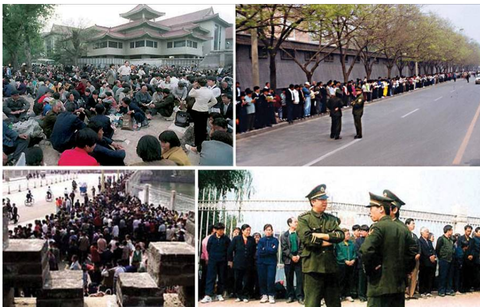
一九九九年四月二十五日，上万名法轮功学员自发到国务院信访办公室（中南海附近）和平上访。他们没有口号标语、没有阻塞交通，静静等候十几个小时。

凯达格兰大道之于台湾，犹如天安门之于中国大陆，而今几千人的炼功祥和景象，不但让中共的谎言不攻自破，更让“中国的希望”延续。这样祥和宁静的炼功场面，在繁华热闹的台北市成为一道最美的风景线。◇