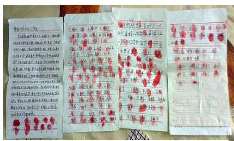
141 名街坊邻居联名要求释放