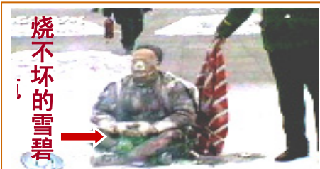
▲“天安门自焚”，漏洞百出：人烧糊了，装汽油的塑料雪碧瓶却烧不坏。中共以此煽动人们的仇恨，为迫害法轮功制造借口。

人在做，天在看，善恶有报是天理。那些跟随大魔头江泽民一伙迫害法轮功的王立军、薄熙来、周永康、610头子李东生等不都遭到恶报了吗？难道还敲不醒你们吗？还要等到恶报临头吗？赶快停止迫害，保护善良，立功赎罪，不要对中共抱有任何幻想！不当邪党陪葬品！天灭中共是必然，只有退出中共，才有希望和未来。