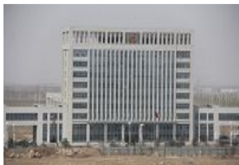
铁岭市铁岭县法院