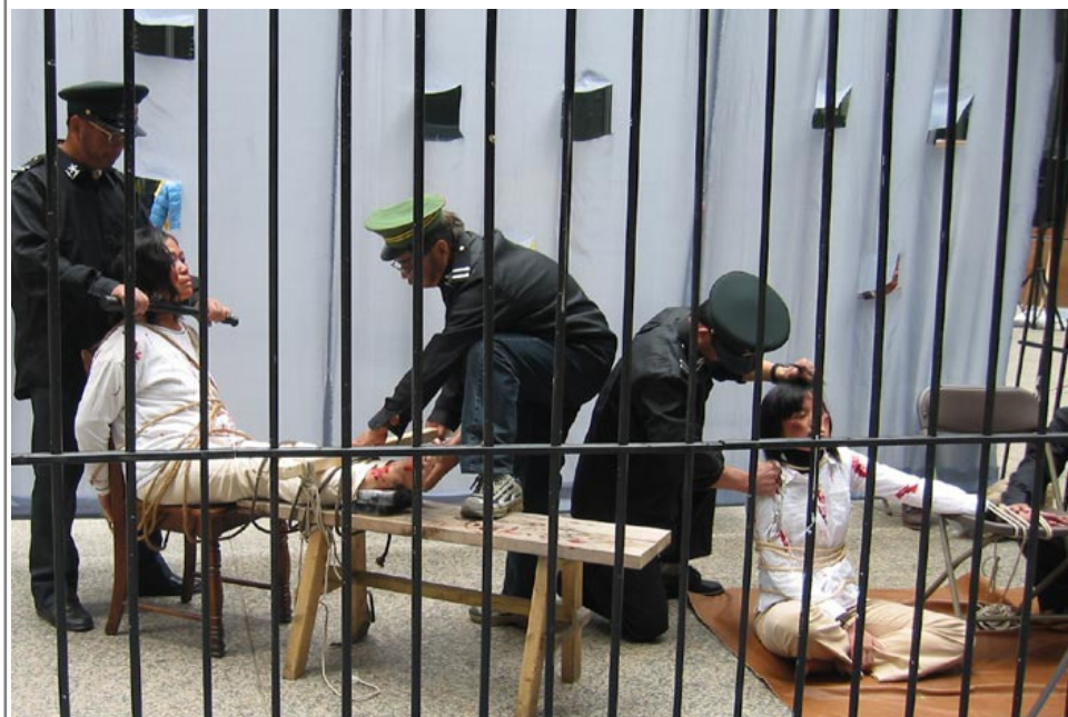
中共酷刑：老虎凳、插竹签（真人演示图）