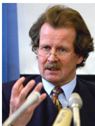
曼弗雷德·诺瓦克先生

【明慧网】联合国“酷刑问题”特派专员曼夫德·诺瓦可先生于2008年12月2日结束了他在中国的两个星期的关于酷刑问题的实地调查，于当日在北京召开新闻发布会，这是联合国以及国际社会对中国进行的第一次正式的人权与酷刑问题的实地检查。在新闻发布会上，诺瓦可先生说，酷刑问题在中国非常普遍，滥用酷刑遍及全国，中国政府应该遵循国际人权基本准则和联合国宪章。中国有着世界上最大的监狱系统，而且常常通过酷刑来迫使无辜的人认罪。