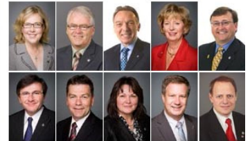
国会议员贺法轮大法弘传 23 周年