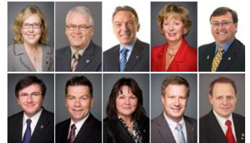
国会议员贺法轮大法弘传 23 周年