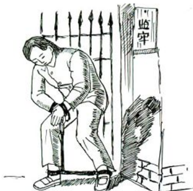
中共酷刑：非法绑架关押

各个高校，包括中国科学技术大学、安徽建筑学院、合肥工业大学等高校，出于恐惧，中共千方百计的绑架、迫害这些法轮功学员，试图转化他们放弃对“真善忍”的信仰。