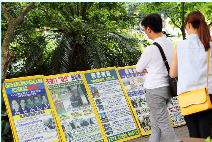
台湾慈湖风光旖旎，是许多大陆游客的必经之地，那里的法轮功真相展板也成了大陆游客平日难得一见的风景。图为游客在看“天安门自焚是中共导演的骗局”、“江泽民迫害法轮功 面临国际逮捕”等真相。（摄于 2015 年 5 月 3 日）

佛光涤荡正苍穹， 春到人间暖意浓。 真相润成三月雨， 善言敲响五更钟。 人心唤醒迎新日， 花木绽萌换旧容。 大法洪恩人得救， 慈悲普度化春风。