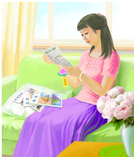
绘画《读真相》 作者：大陆大法弟子

我递给她纸巾，温和地说：“别听电视的谎言，那个杀女儿的不是法轮功学员。你看我会杀小陆吗？”她瞪大眼睛看着我，破涕为笑：“不会！”她也觉得要说我杀人是可笑的事。