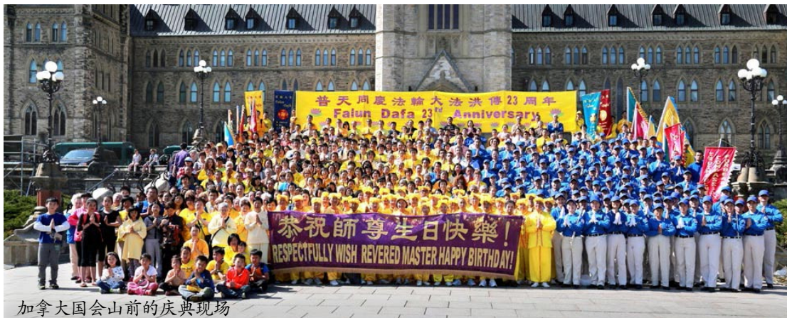
加拿大国会山前的庆典现场