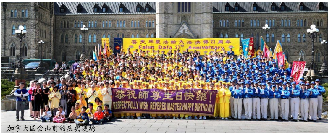
加拿大国会山前的庆典现场