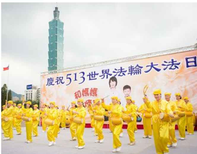
2015 年 5 月 3 日，台北法轮功学员在国父纪念馆户外广场的文艺表演活动