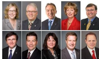
国会议员贺法轮大法弘传 23 周年