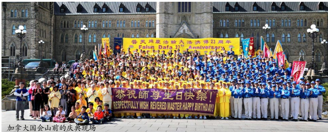
加拿大国会山前的庆典现场