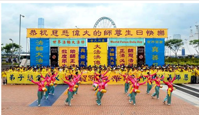
香港法轮功学员庆祝第十六届“世界法轮大法日”

©2015 年 5 月 13 日是法轮大法弘传 23 周年纪念日、第十六届“世界法轮大法日”和法轮功创始人李洪志先生华诞，各国法轮功学员举行盛大的庆祝活动，中国大陆的法轮功学员和明真相的世人在明慧网上发表上万份贺卡贺辞，诚挚感恩法轮大法。