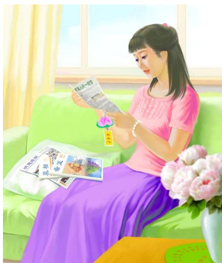
绘画《读真相》 作者：大陆大法弟子

我递给她纸巾，温和地说：“别听电视的谎言，那个杀女儿的不是法轮功学员。你看我会杀小陆吗？”她瞪大眼睛看着我，破涕为笑：“不会！”她也觉得要说我杀人是可笑的事。