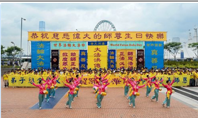
香港法轮功学员庆祝第十六届“世界法轮大法日”

◎2015 年 5 月 13 日是法轮大法弘传 23 周年纪念日、第十六届“世界法轮大法日”和法轮功创始人李洪志先生华诞，各国法轮功学员举行盛大的庆祝活动，中国大陆的法轮功学员和明真相的世人在明慧网上发表上万份贺卡贺辞，诚挚感恩法轮大法。