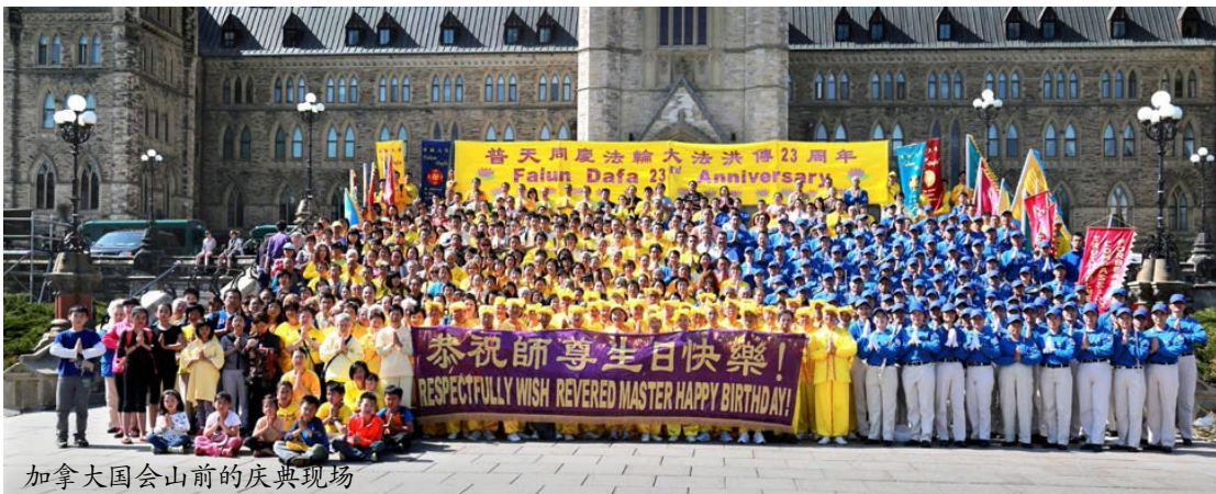
加拿大国会山前的庆典现场