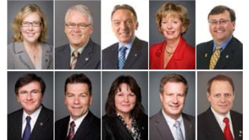
国会议员贺法轮大法弘传 23 周年