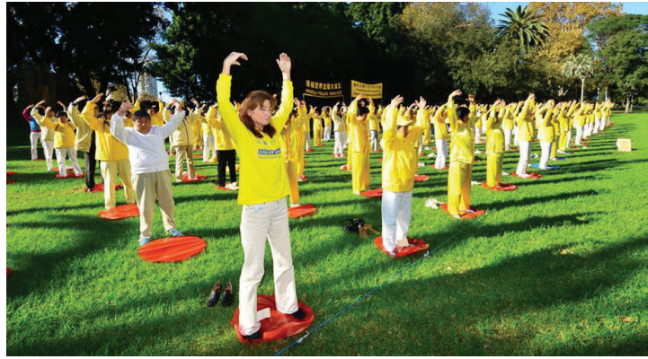
2015년 5월 9일, 파룬따파가 전 세계에 전해진 지 23주년 되는 날을 기념하기 위해 시드니 파룬궁 수련생들이 시드니 하이드 파크 (Hyde Park)에서 단체 연공을 하고 있다.

내가 11살 되던 때, 새 엄마가 왔는데 새 남동생을 데리고 와 우리와 함께 살게 됐다. 새 엄마는 파룬따파를 수련하는 사람이었다. 그녀는 우리 세 남매를 마치 친자식처럼 아주 잘 대해주었다. 하지만 우리는 새 동생을 배척하면서 늘 작은 일을 가지고 싸우며 소란을 피웠다. 아빠도 새 동생을 좋아하지 않았고 그에게 좋은 표정을 짓지 않았으며 항상 뒤에서 나무랐다. 이는 새 엄마를 몹시 괴롭혔지만, 새 엄마는 여전히 우리를 선택