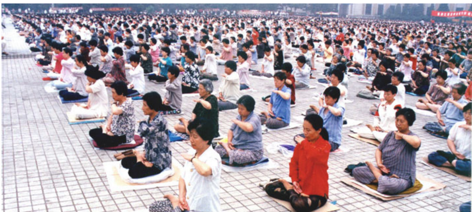
图：1998 年 5 月，沈阳万名法轮功学员集体炼功

饭，四个菜，大家随意凑够十人就开始吃，吃完每个人放下 6 元钱静静地离开。也就半个多小时，一千多人全吃完饭离开了。