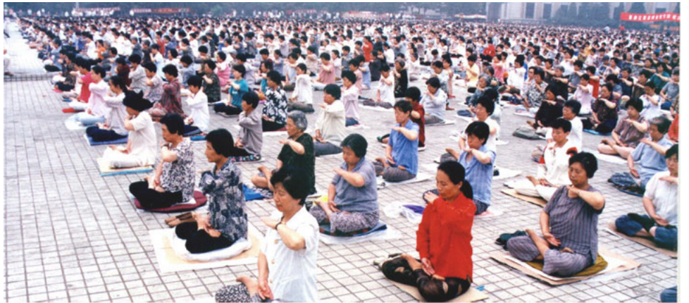
图：1998 年 5 月，沈阳万名法轮功学员集体炼功

饭，四个菜，大家随意凑够十人就开始吃，吃完每个人放下 6 元钱静静地离开。也就半个多小时，一千多人全吃完饭离开了。