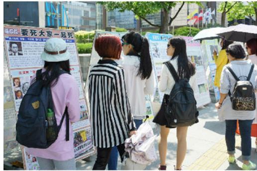
上图：大陆游客在拍照法轮功学员炼功场面。 下图：大陆游客在看真相展板。