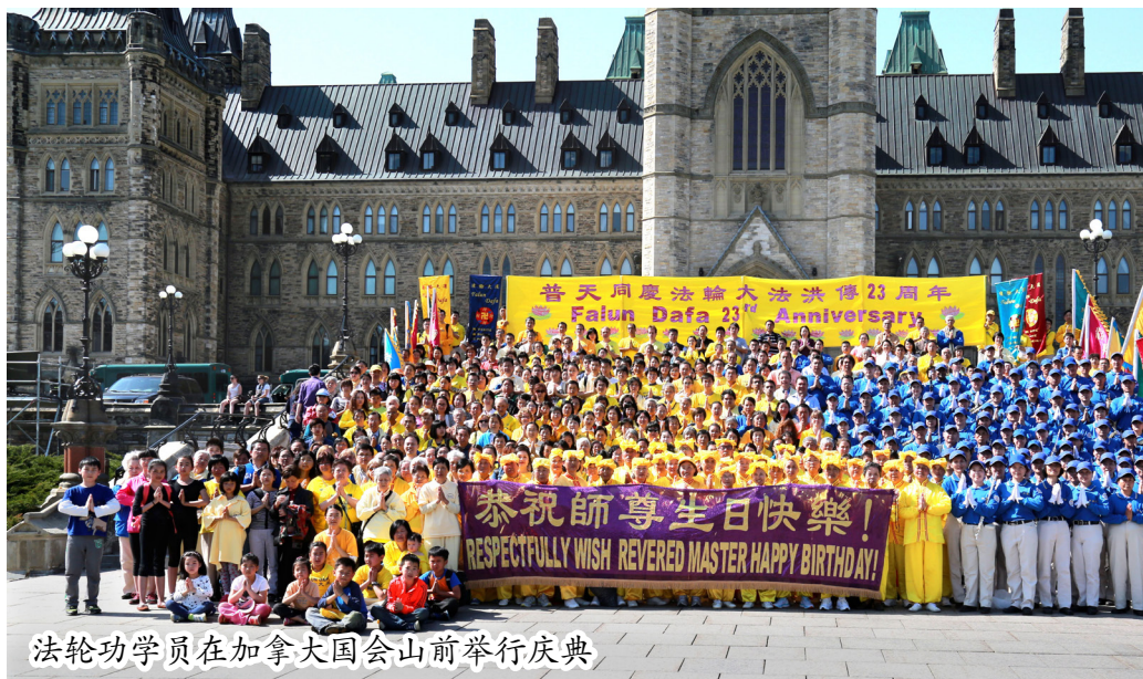
法輪功學員在加拿大國會山前舉行慶典