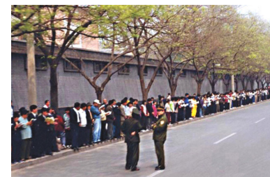
“4·25”上访现场安静，警察不用维持秩序，在一旁聊天。国际社会称此次上访为“中国上访史上最理性、平和的上访”。

从上述“三点要求”也可以看出，法轮功学员只想拥有一个自由修炼的环境和做好人的权利，不牵扯任何政治问题。“搞政治”之说只不过是中共整人的“大帽子”。◇