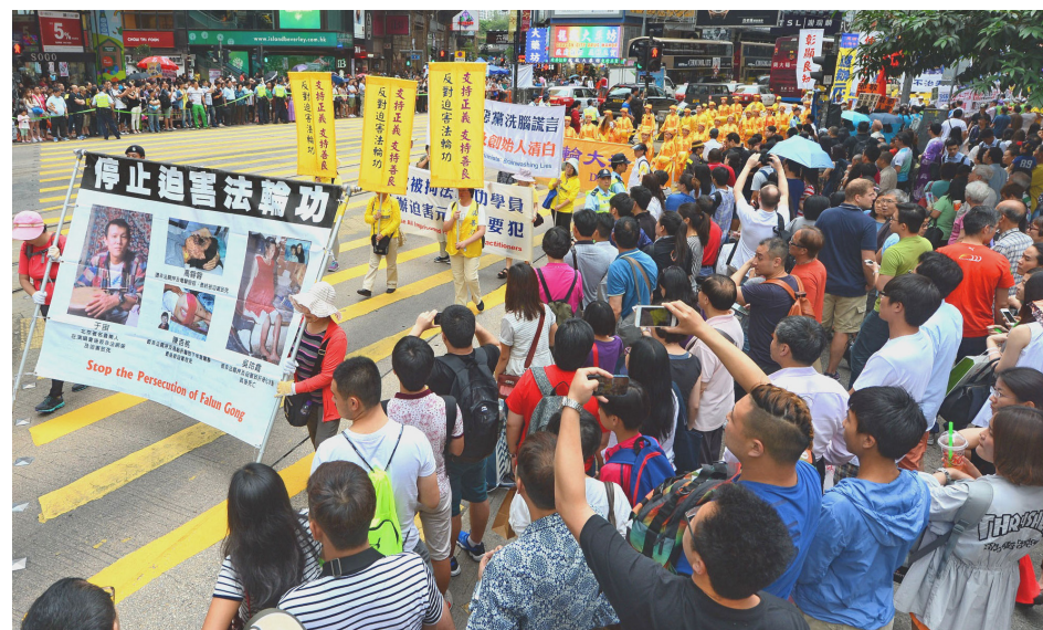
2015 年 5 月 10 日香港法轮功学员大游行，大陆游客争相拍摄中共江泽民集团酷刑迫害法轮功学员致毁容、致死的真相。

自从建立了“处理法轮功问题领导小组”和“610 办公室”以后，对法轮功的迫害就由各级“处理法轮功问题领导小组”和“610 办公室”监督和实施。尤为恶劣的是，各级“610 办公室”接受其上一级“610 办公室”的指令，要求其工作人员对法轮功信仰者强行“转化”（逼迫放弃信仰），手段包括洗脑、虐待和酷刑折磨。（选摘自《被告江泽民在迫害法轮功中的作用和角色》）◇