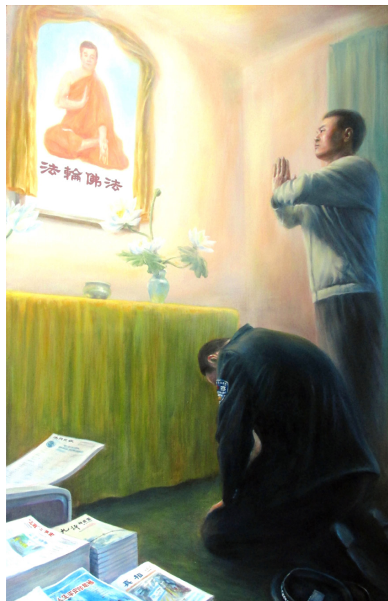
作者：中国西北地区法轮功学员 归真