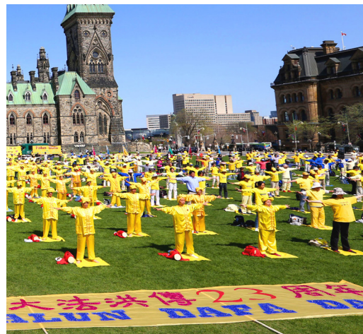
加拿大国会山前集体炼功