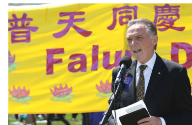
国会议员彼得·肯特