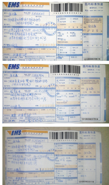
3封起诉江泽民的快递邮件

此前，5月11日，张兆森已通过邮政快递向最高人民检察院和最高人民法院递交了对江泽民的刑事控告书。◇