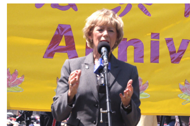
国会议员朱迪·斯格若