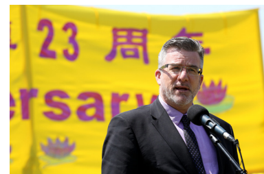
国会议员克莱格·斯哥特