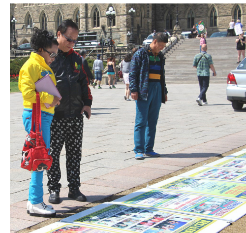
民众阅读法轮功真相

情况我非常清楚，因为我的邻居都在炼，他们都是非常善良和诚实的人，现在中国善良的人就存在于这群人中了，我非常敬佩他们。在国内，他们受监控；在海外，他们是如此自由和受欢迎。”他表示要在现场学炼法轮功。