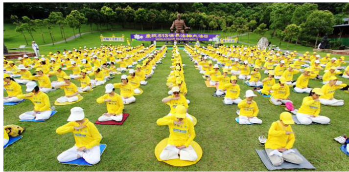
图：2015年的5月13日是法轮大法开传23周年纪念日暨第十六届“世界法轮大法日”。全世界法轮功学员和善良民众在每年的五月，以不同的形式庆祝这个感恩的日子。上图是5月3日台湾法轮功学员集体炼功，提前欢庆“五一三世界法轮大法日”。

妻子的病也牵动亲朋好友、街坊邻居，有的熬汤送饭，有的按摩开导，忙得团团转却一筹莫展。好友修炼法轮功，送来《转法轮》和法轮功真相光碟。