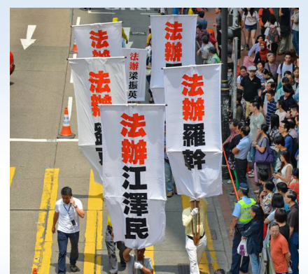
图：2015年4月26日香港举办反迫害和声援两亿人退出中共党、团、队大游行，吸引了众多民众和大陆游客观看。

惶不安之中了，这种“谁是下一个”的精神煎熬也是他们早先给法轮功学员制造恐惧的报应。