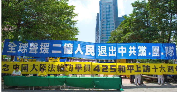
图：2015 年 5 月 2 日，二千多名法轮功学员在台湾高雄市举办声援二亿人民退出中共党、团、队的活动。

有游客问义工为什么“三退”能保平安？义工回答：“声明退出中共组织，就表示加入中共党、团、队时对着中共的血旗发的毒誓作废，你身上带着的党、团、队组织的印记就会被抹掉。之后，才会有神佛看护你。神佛保佑你，能不安全吗？”一群人听了连声说：“谢谢，谢谢你。”游客说：“李大师派人来救我们，能