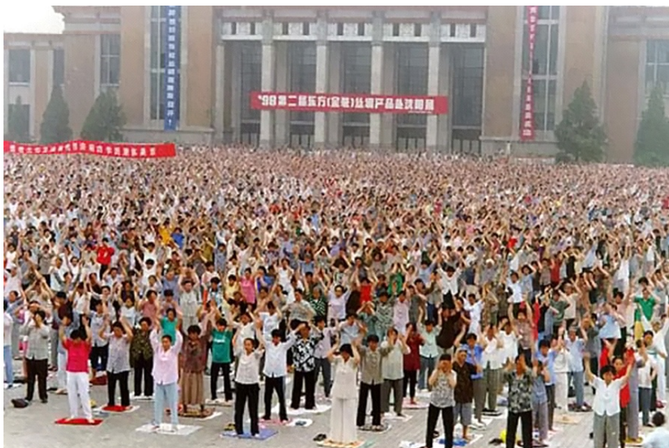
1998 年 5 月的一个星期日早晨，一万多名法轮功学员在沈阳工业展览馆门前的广场上举行了集体晨炼。虽然人数众多，学员彼此互不相识，但秩序井然，没有任何嘈杂、喧闹。万人晨炼结束后地上没留一片纸屑。

我带着一儿一女单过。原来和公婆在一起种的地要分开。当时正赶上夏初，青苗已有一尺来高，但长势不均，有高有矮。我想，公婆年岁大了，种地不容易，就让他们先挑。结果长